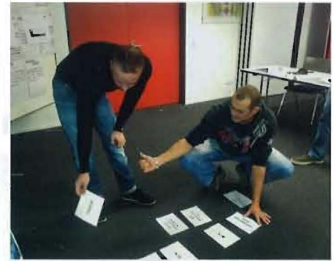
Die Nachfrage nach den Bildungsangeboten der ASTAG wächst.

Die BBB bildet seit 30 Jahren Berufslernende im Bereich Lastwagenführer aus und stieg 2009 in die Grund- und Weiterbildung der Chauffeure ein. Um sich weiterzuentwickeln, suchte die Schule einen starken Partner und hat diesen mit der ASTAG auch gefunden. Die BBB wird sich künftig auf die berufliche Grundbildung konzentrieren. Die überbetrieblichen Kurse für Strassentransportfachleute EFZ sowie den gesamten Aus- und Weiterbildungsbereich wird die ASTAG Schweiz übernehmen. Somit entsteht im Wirtschaftsballungsraum Aargau ein Kompetenzzentrum in Sachen Aus- und Weiterbildung im Bereich Transport und Logistik. Mit dem Ausbau und der laufenden Anpassung an die Branchenbedürfnisse soll das Potenzial an inländischen Fachkräften genutzt werden. Bürgisser erklärt: «Es ist ein Anliegen des Verbands, die Professionalität in allen Funktionen und auf sämtlichen Stufen zu fördern und das Branchenimage weiter zu verbessern.»